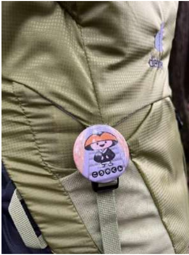
今回の主役こうやくんです