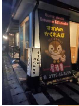
宿泊組のディナー会場、(❄️▽)ノ