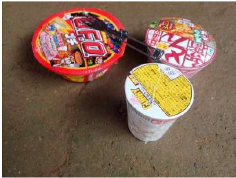
山で食べるカップ麺おすすめはカレーヌードル。なぜならばスープ袋のごみが出ないからです