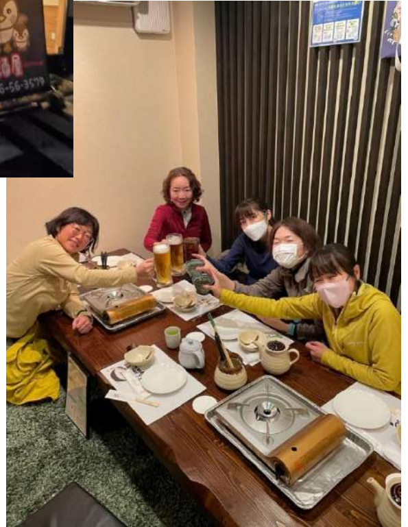
1日目無事終了 乾杯🍷