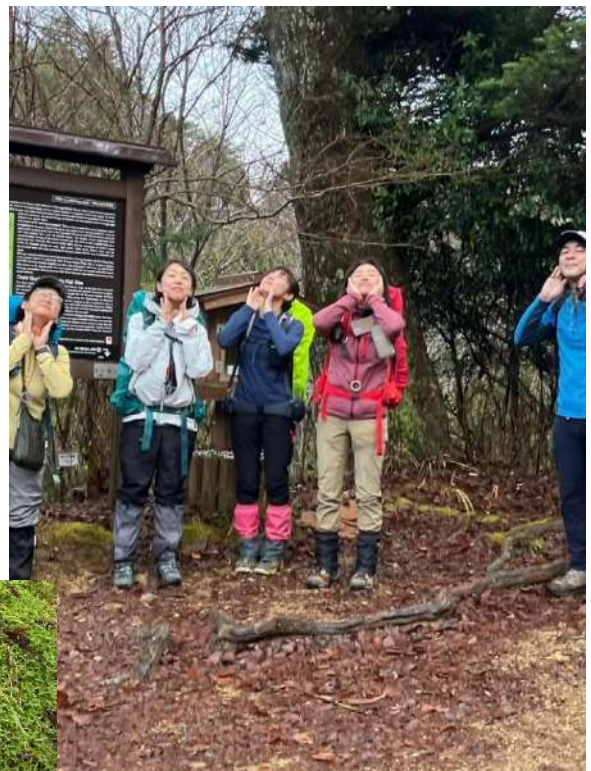
轆轤峠で轆轤ポーズ