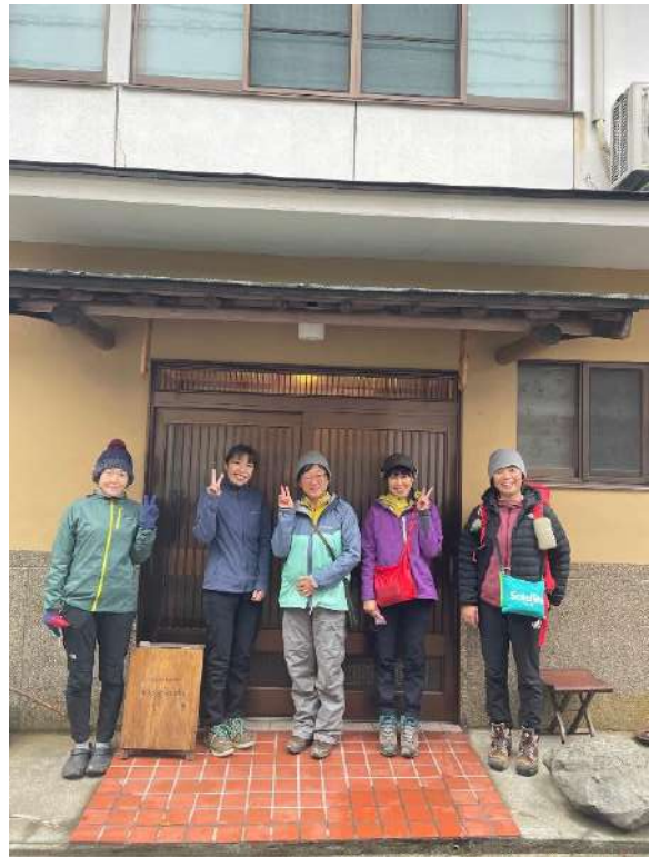
宿泊先の HACHIHACHI の前で📷