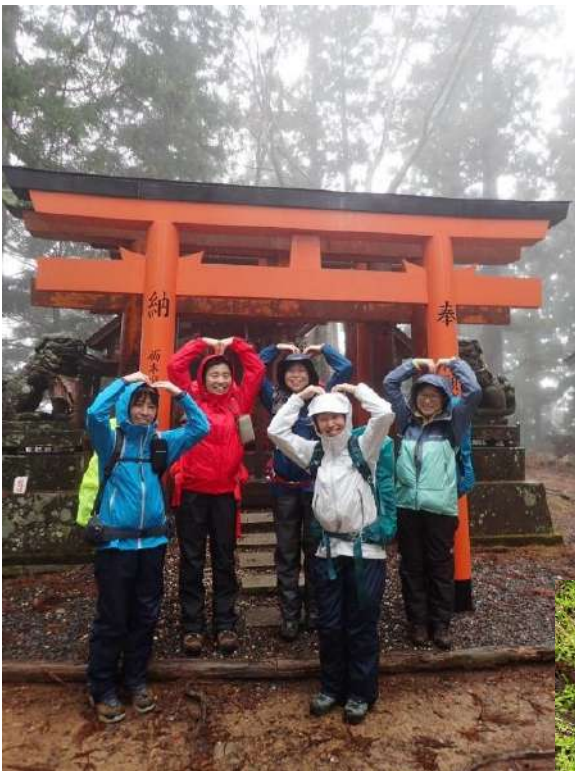
お山なので雨でも笑顔で♡ポーズ

・自宅で準備をしているときに最後にカバンに入れようと机の上に置いた印刷した地図をカバンの中に入れ忘れてしまい、地図を見ることができなかった。今回は持ってきているメンバーに見せて頂いたが地図を持たずに山に行くのは遭難しに行くようなものだと反省しました。幸い 2 日目は 2 日目から参加したメンバーに持ってきていただき地図を見ることができた。